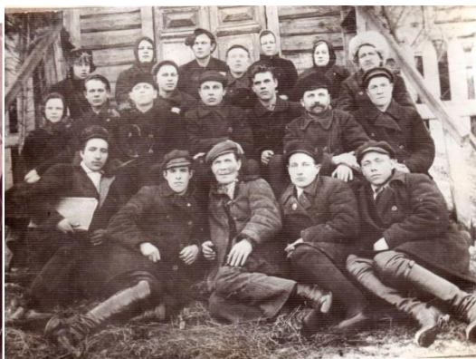
Сигнальщики крейсера Аврора. 1917 год. Политзанятия 1928 год

Село было одно из самых больших в Алатырском уезде. В центре находилась базарная площадь. Работали два затона: Путейский и Умрек. До революции на месте Умрека была пристань графа Рибопьера.